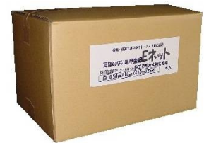
ダンボール箱入り